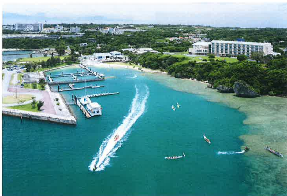
広いスペースをつかったマリンプログラム