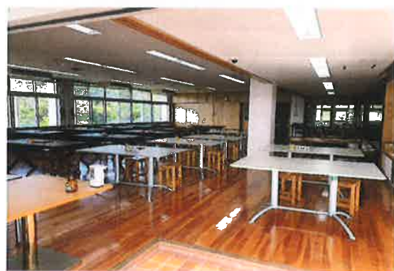
室内プログラムの 対面着席禁止