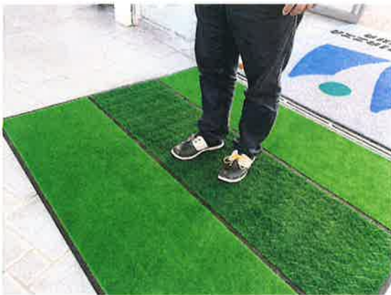
入館時の除菌マット利用