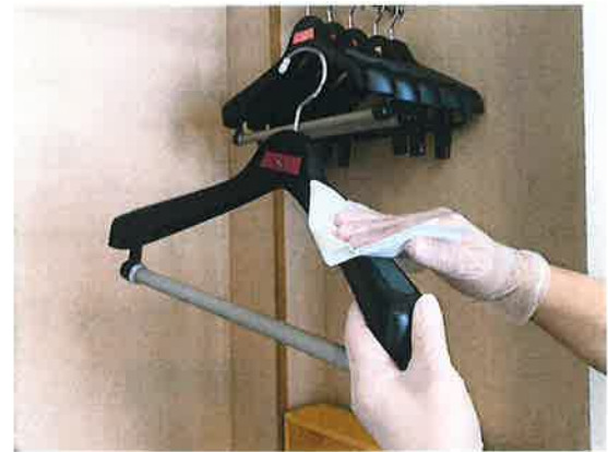
客室清掃時、接触部分も重点的に清掃