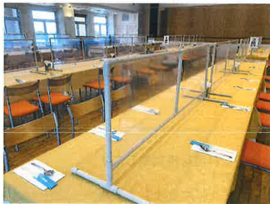
対面防止板の設置