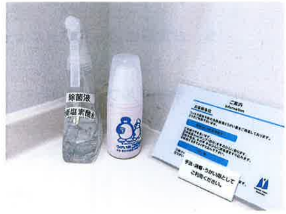
客室内に除菌液・うがい薬設置