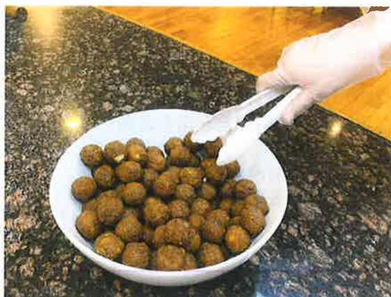
バイキング時の手袋の着用