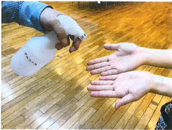
食事毎に両手の消毒