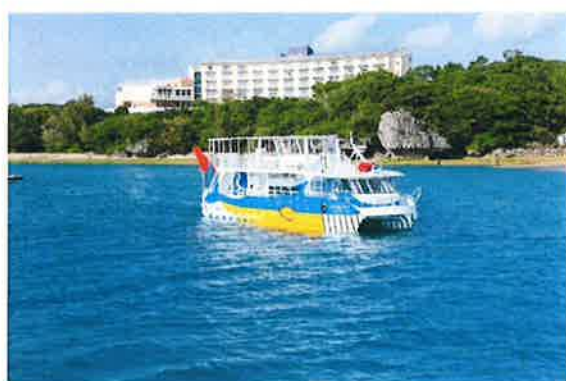
クルージングプログラム