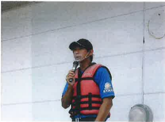
スタッフのマスク着用