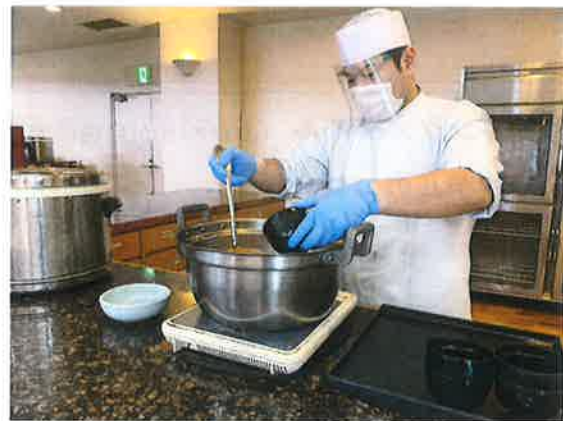
スタッフのマスク・手袋着用 (状況によりフェイスシールド着用)