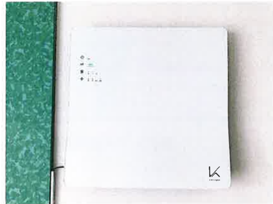
全室光触媒空気洗浄機設置済