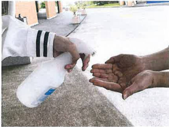
バス下車時両手の消毒