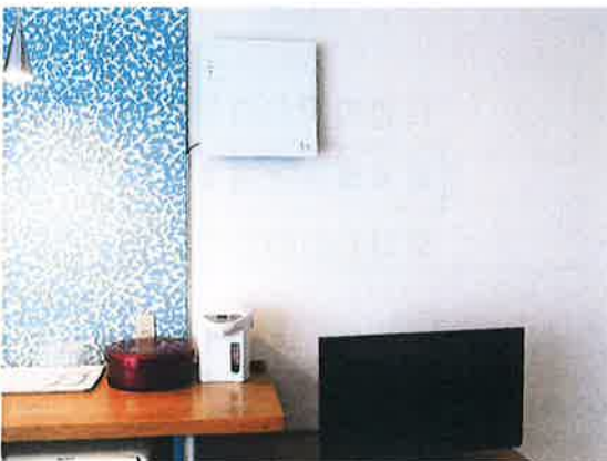
全室光触媒空気洗浄機設置済