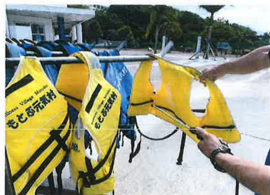
使用機材の消毒 ライフジャケット