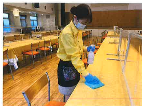
食事毎の各椅子・テーブルの除菌 (状況によりクロスの交換)