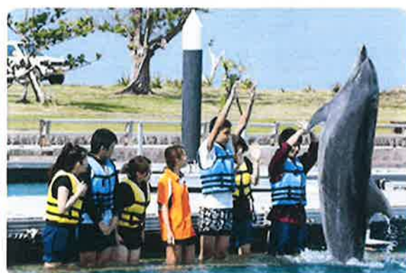
ドルフィンプログラム