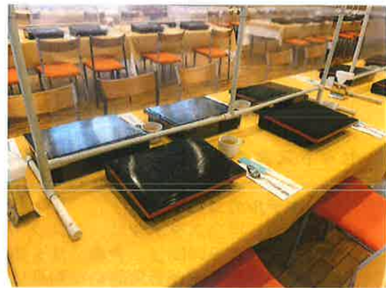
対面防止板の設置 (セット料理の準備)