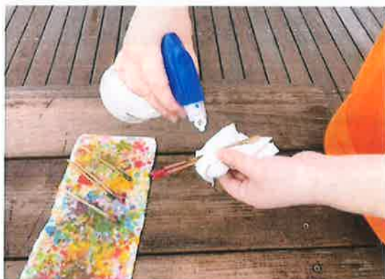
使用機材の消毒 文化