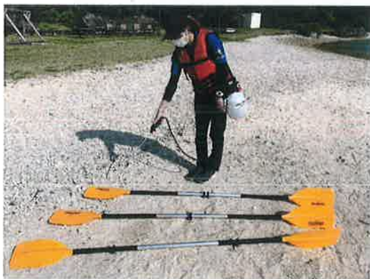
使用機材の消毒 マリン