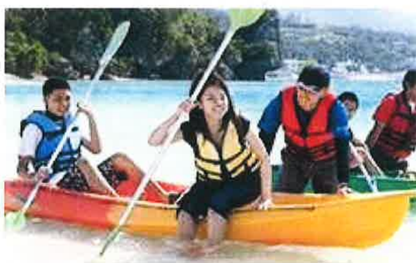
マリンプログラム