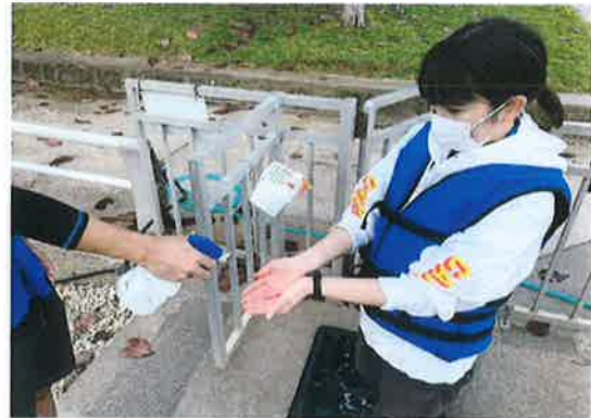
プログラム毎の両手の消毒